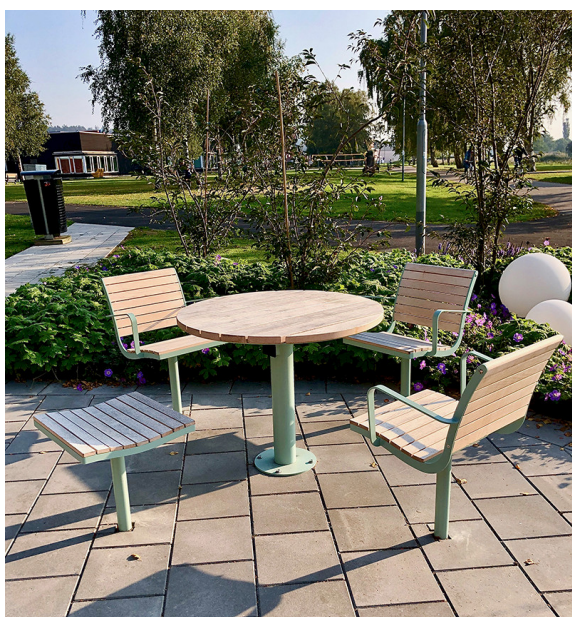
High Table tillsammans med fåtöljer och pall från vår möbelserie Parco.