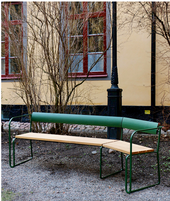
Sigill finns i en rak eller, som här, en vinklad version. Stativ pulverlackerat med ett finstruktur lack.