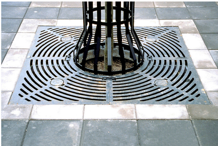
Markgaller som är "leveransmålat" och därefter underhållsfritt.