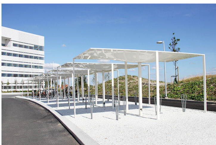
Cykelpollare Duo i varmgalvaniserat utförande.