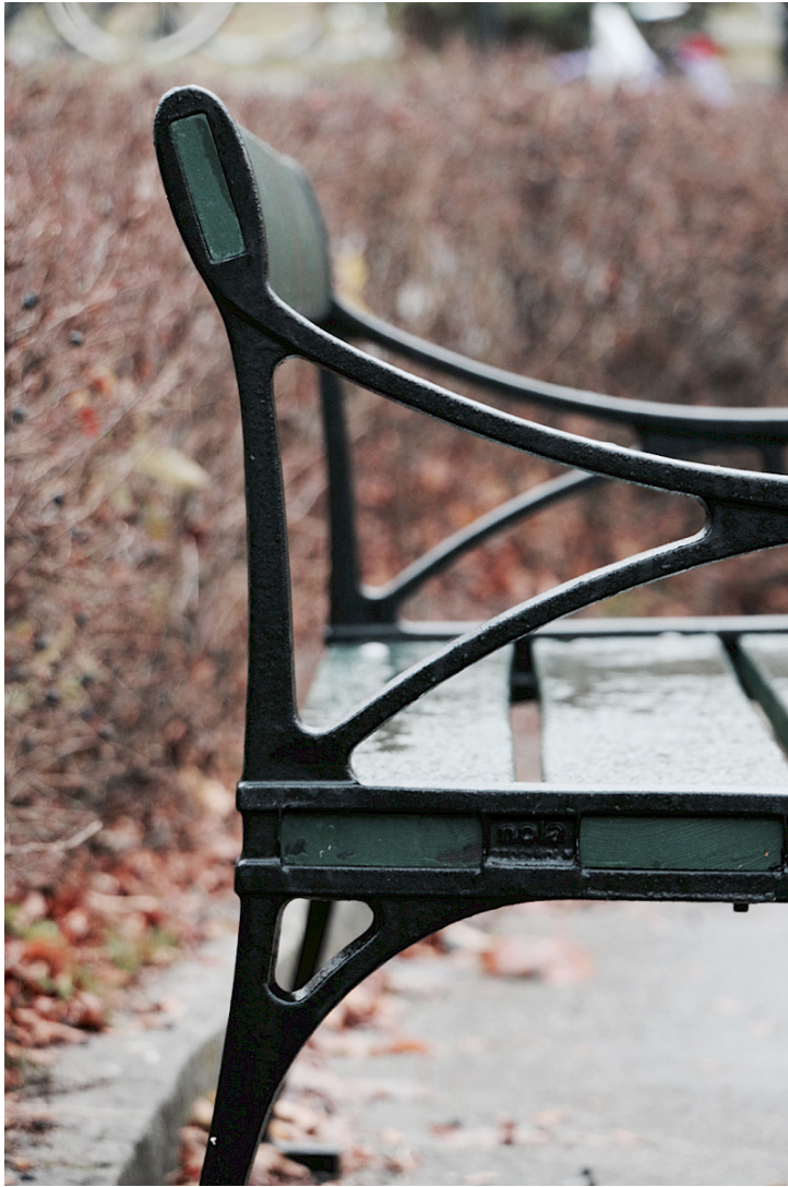
Gavel på Tessin soffan. Rostskydds- och färdigmålat gjutjärn från fabrik. Bättringsmålas med alkydfärg.