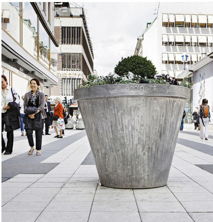
Planteringskärlet Folke i gjuten återvunnen aluminium.