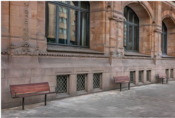
Parco elegant i Jatoba utanför Posthuset i Stockholm.

Accoya® är i det närmaste underhållsfritt och kräver ingen särskild behandling för att bevara sina unika egenskaper. Om svarta fläckar skulle uppstå på virket från föroreningar i luften så tas dessa lätt bort med någon sort av möbeltvätt.