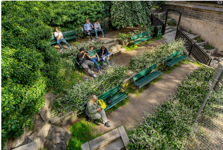
Ommålad Kalmarsund-soffa vid Mosebacke torg i Stockholm.