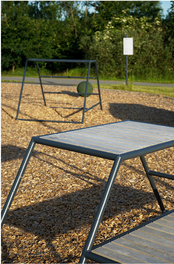
Kebne utegym modul 4 med träytor av Accoya®.