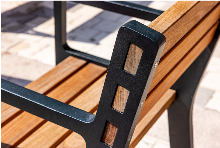
Frank stol med gavel av 100 procent återvunnen aluminium.