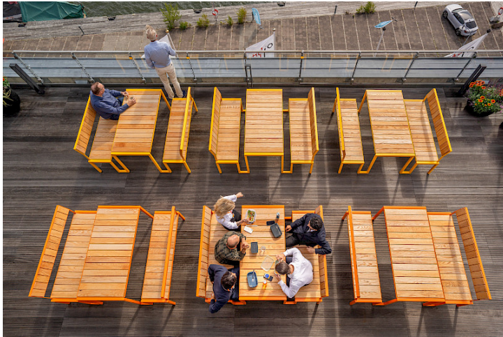
Oljad ek när den är ny, här Långbordet på en takterrass.