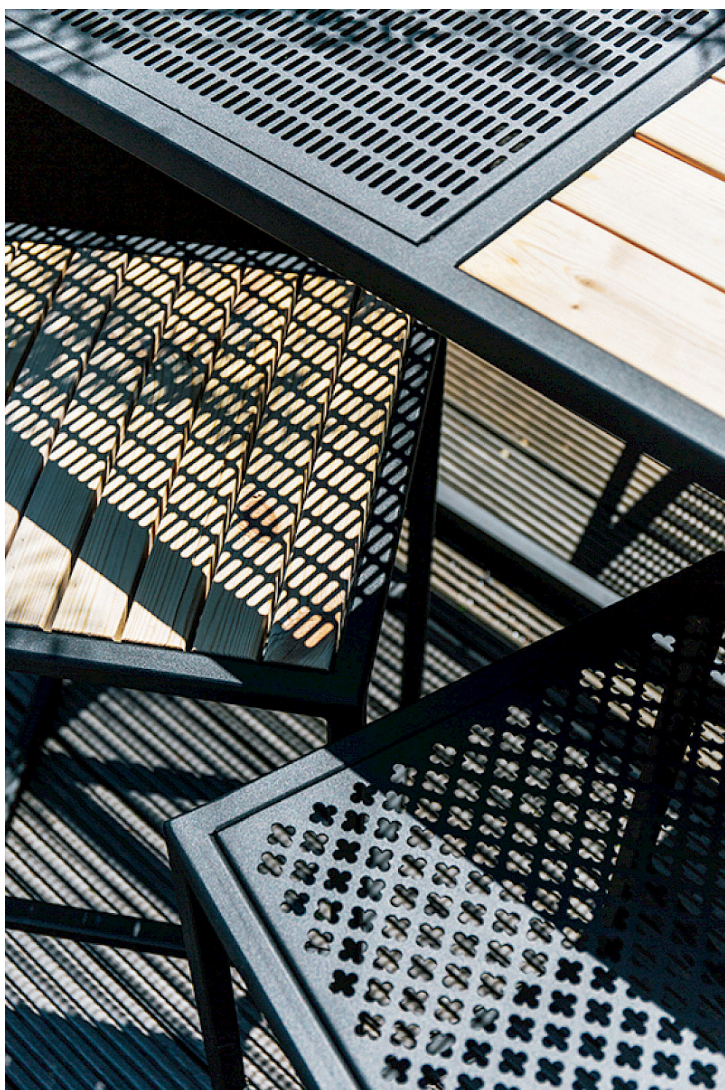
Join möbelgrupp i elförzinkat pulverlackerat stål.